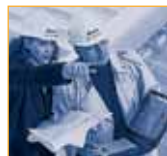
Dach und Fassade